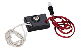
CONVERTISSEUR DEMD 060974A – 24 VCA à 9 VCC