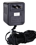
TRANSFORMATEUR D'ALIMENTATION DEMD 060958A

Pour conversion au fonctionnement par transformateur d'alimentation