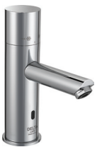
ROBINET DE LAVABO THERMOSTATIQUE ÉLECTRONIQUE

DEMD-611LF – 2,5 L/min (0,66 gal/min) 0,64 L/cycle (0,17 gal/cycle)*